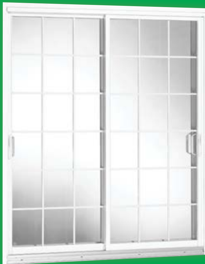
Porte blanche avec carrelage standard rectangulaire blanc

NUL AUTRE ne fabrique des portes patio d'avant-garde comme Portes Standard Inc. le fait depuis plus de 50 ans.