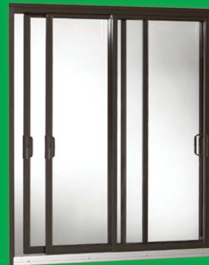
Porte couleur brun commercial